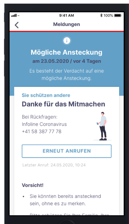
Abb. 1: SwissCovid App : Représentation d'un contact possible avec un cas de COVID-19

L'analyse pour la COVID-19 (par PCR et / ou par sérologie) peut également être réalisée chez des personnes ayant eu un contact étroit avec un cas de COVID-19, qui sont asymptomatiques et se trouvent en quarantaine sur décision des autorités. L'indication à effectuer l'analyse est posée par le service cantonal compétent (le médecin cantonal ou le service de traçage de contact qui l'a